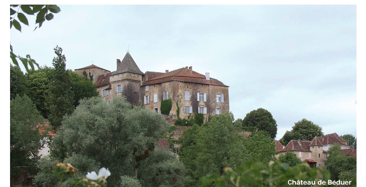
Château de Bédouer

A la révolution, l'église tomba en ruines et en 1794, elle fut détruite et les matériaux partagés entre les gens du village.