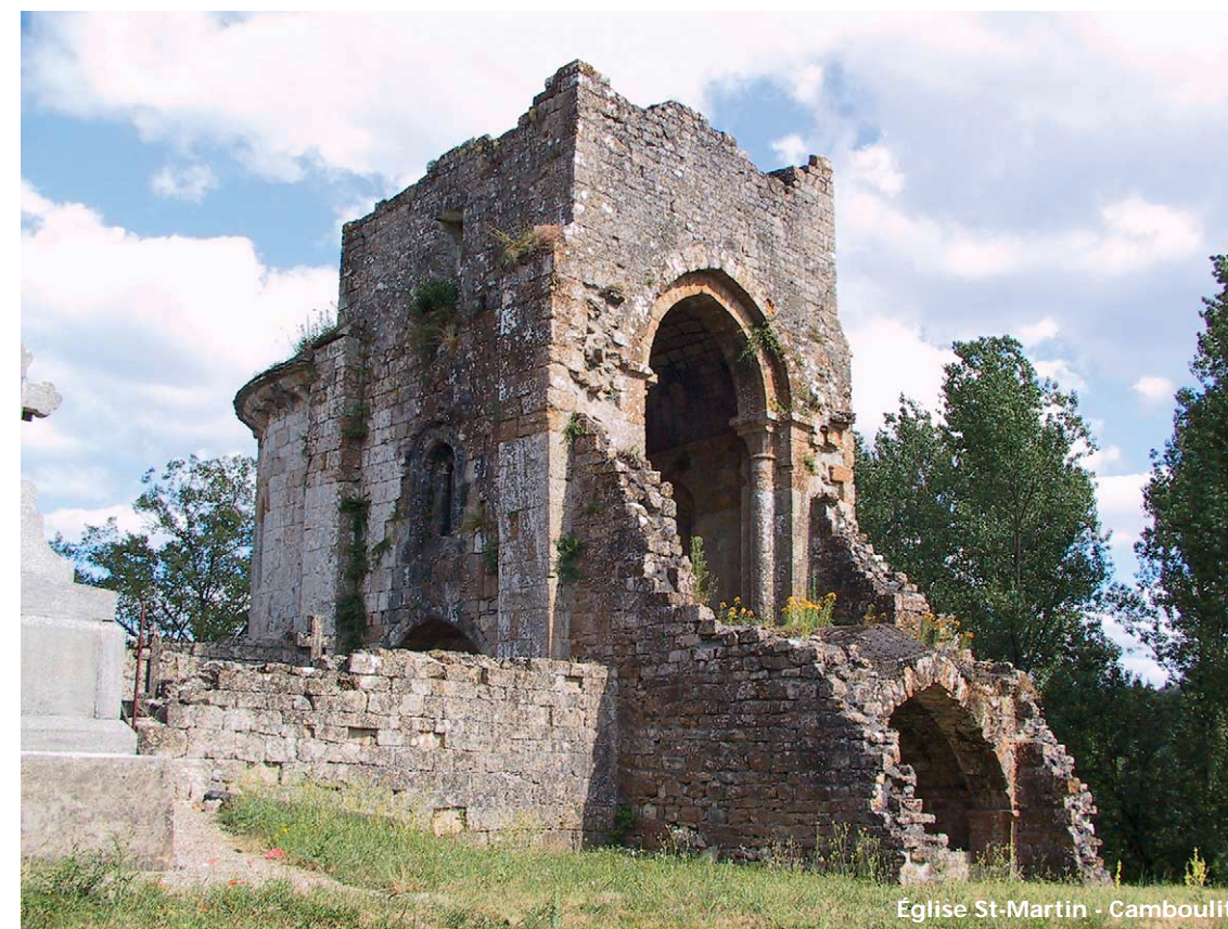
Eglise St-Martin - Camboulit